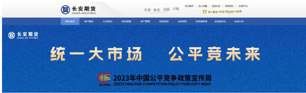
“统一大市场 公平竞未来” banner 主题图