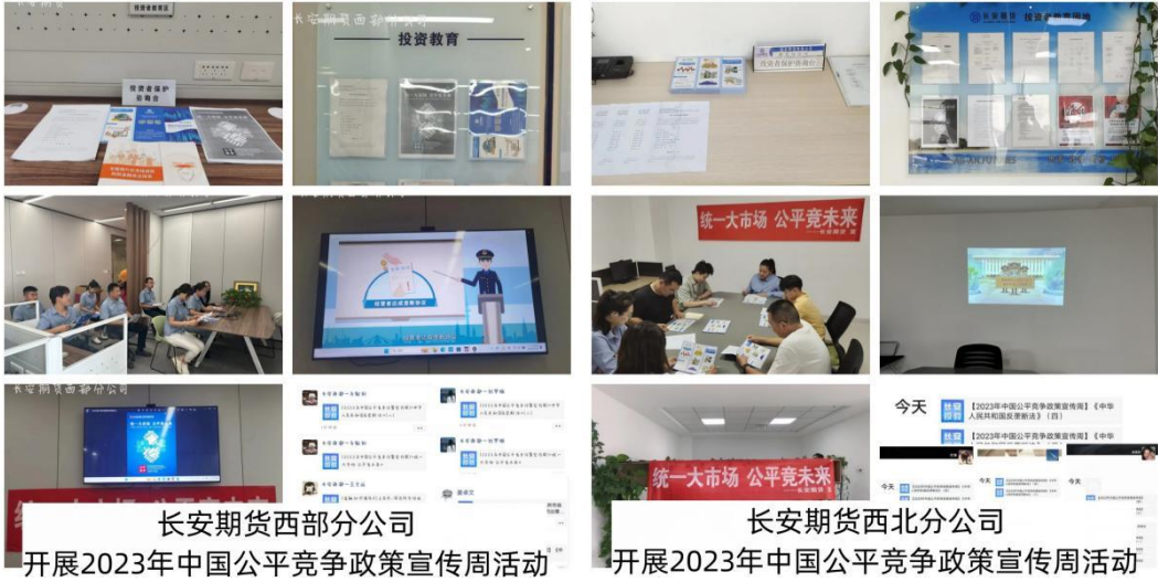
长安期货西部分公司 开展2023年中国公平竞争政策宣传周活动