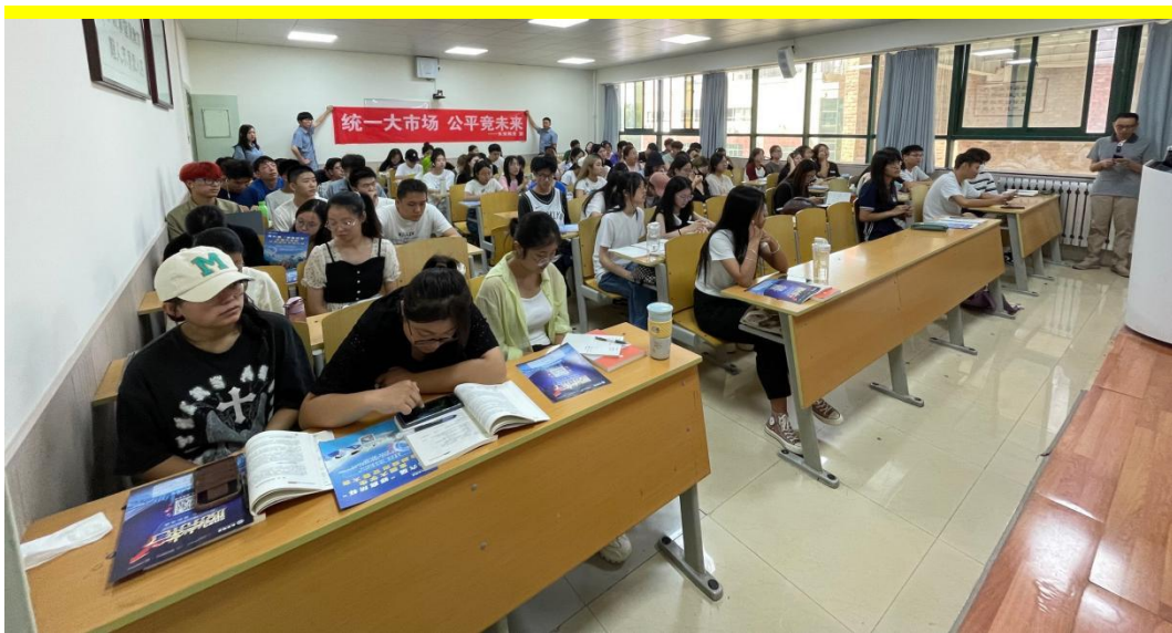
走进西北政法大学宣传公平竞争政策宣传周活动