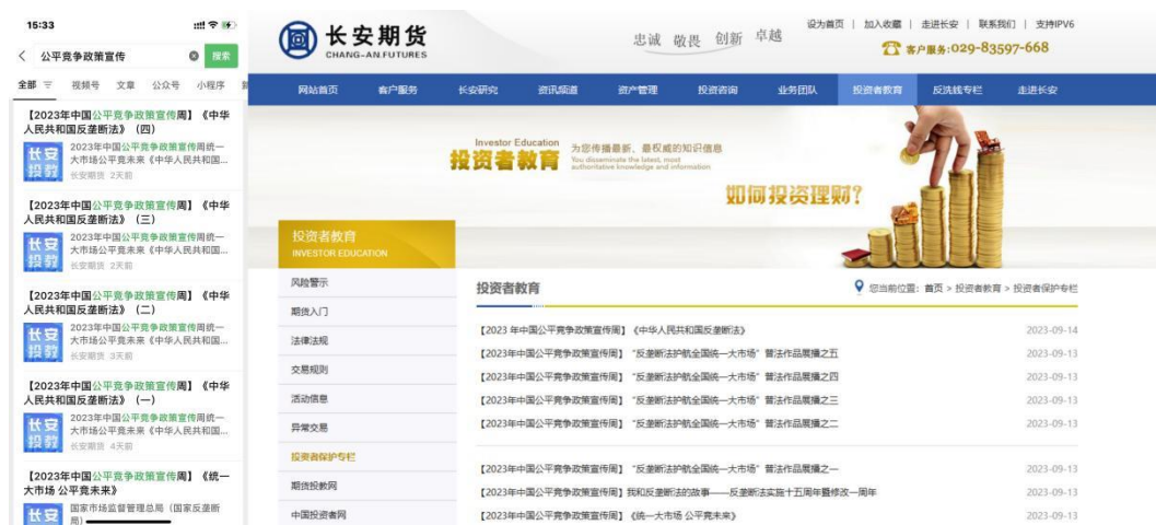
官方微信公众号和官网投资者保护专栏同步更新

活动期间，公司围绕《中华人民共和国反垄断法》等内容展开宣传，持续更新官方微信公众号以及官网投资者保护专栏，保持线上宣传热度。