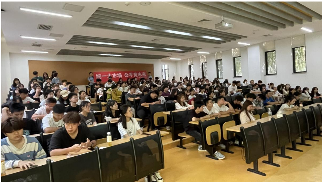
走进西安欧亚学院宣传公平竞争政策宣传周活动

在陕西证监局指导下，长安期货有限公司于9月14日和9月15日，分别在西安欧亚学院和西北政法大学宣传公平竞争政策宣传周活动。活动中，公司讲师为学校师生分享了公平竞争理念和公平竞争文化，向同学们宣传普及了《反垄断法》等法律法规政策，使同学们增强了公平竞争意识。