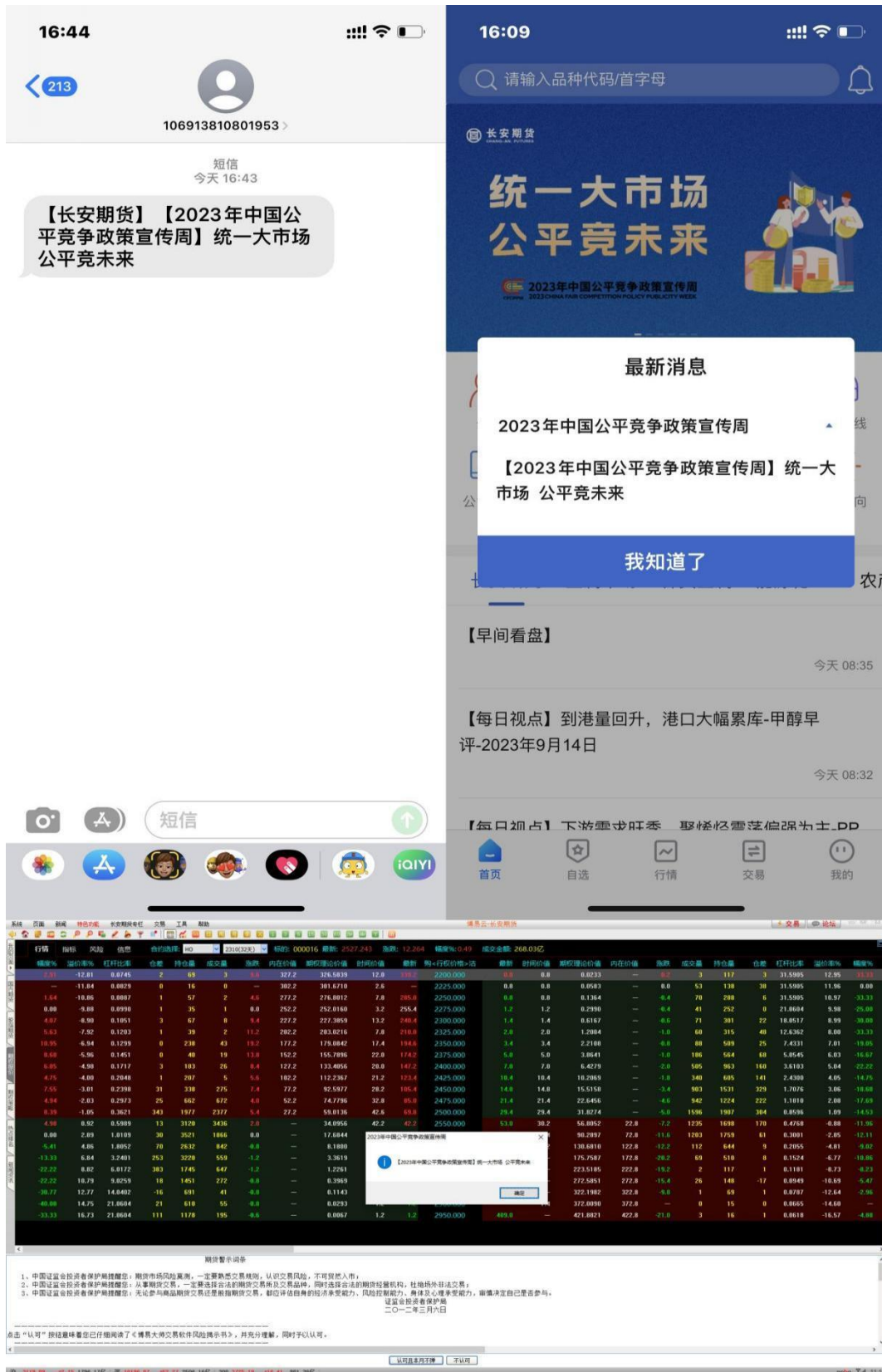
(3) 走进西安欧亚学院和西北政法大学，宣传公平竞争政策宣传周活动