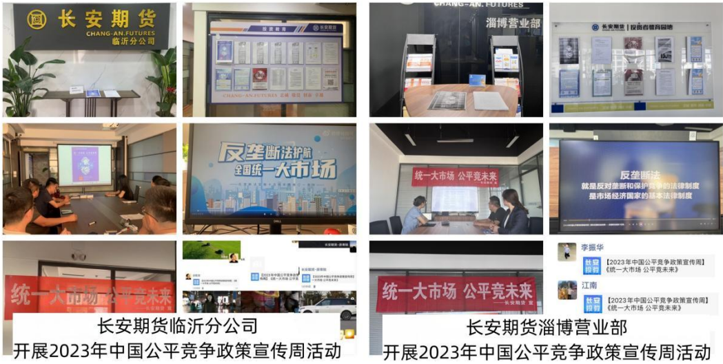
长安期货临沂分公司 开展2023年中国公平竞争政策宣传周活动