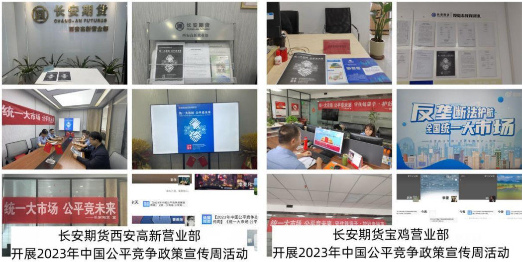
长安期货西安高新营业部 开展2023年中国公平竞争政策宣传周活动