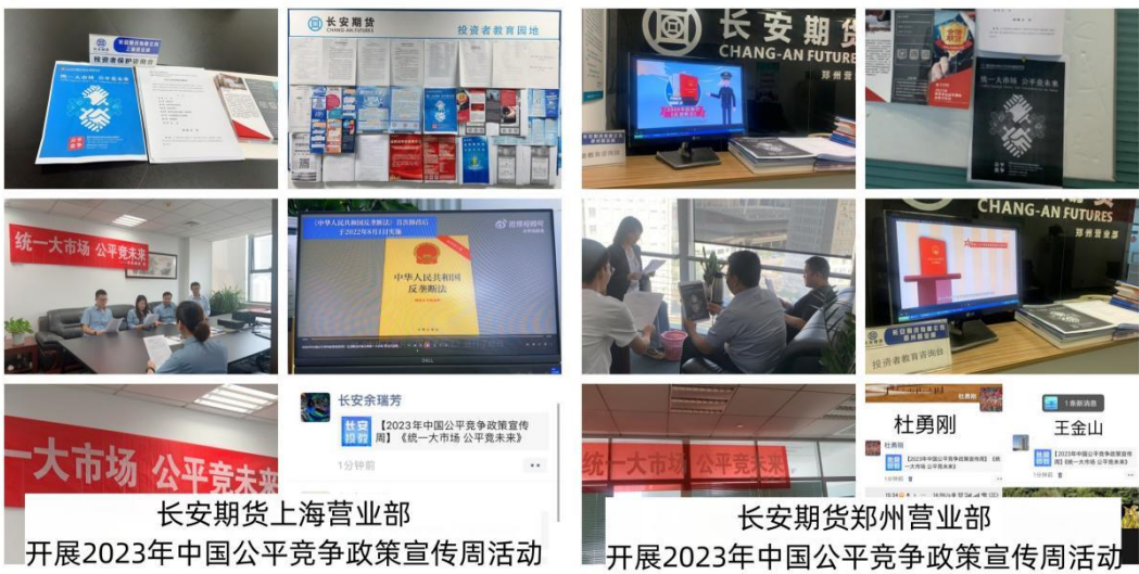
长安期货上海营业部 开展2023年中国公平竞争政策宣传周活动