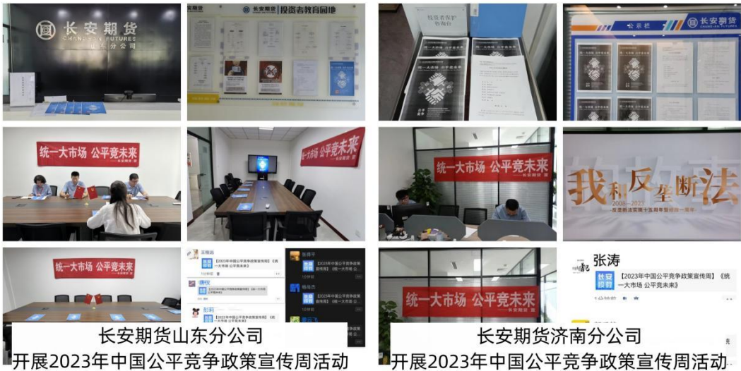
长安期货山东分公司 开展2023年中国公平竞争政策宣传周活动