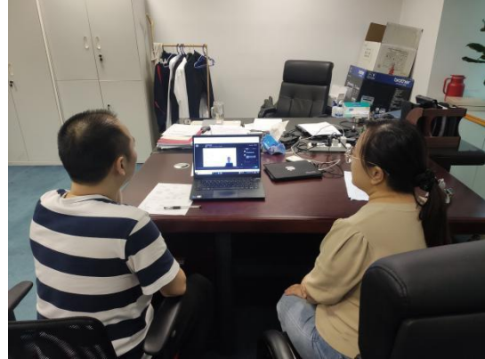
图 12：反垄断系列直播课程学习