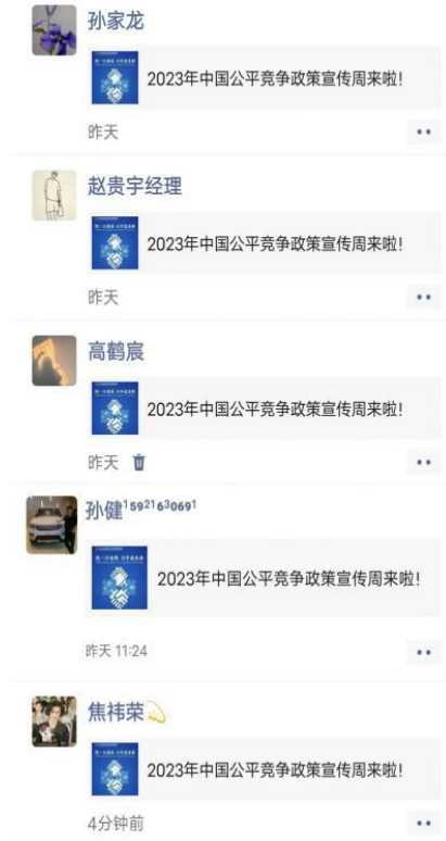
图 8：微信公众号专题宣传及微信朋友圈宣传