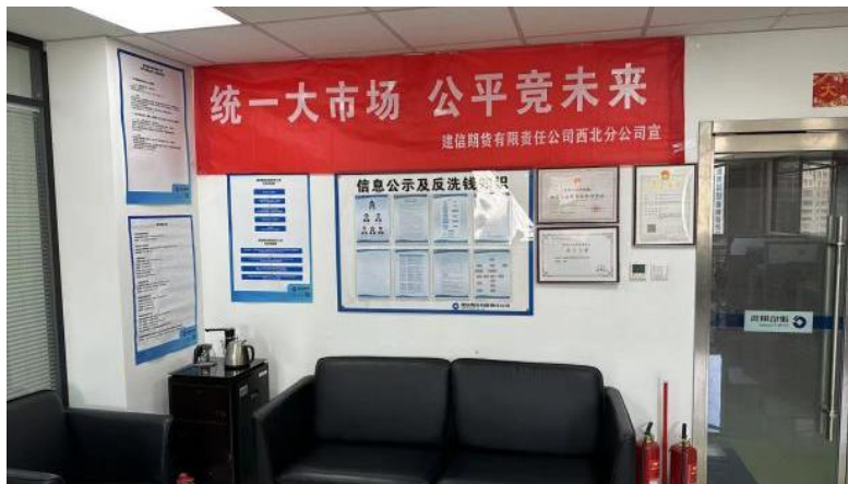
图 2：分支机构在营业场所悬挂主题宣传横幅