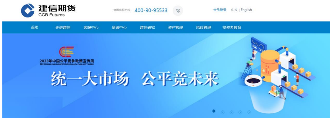
图 5：公司官网主页宣传标语