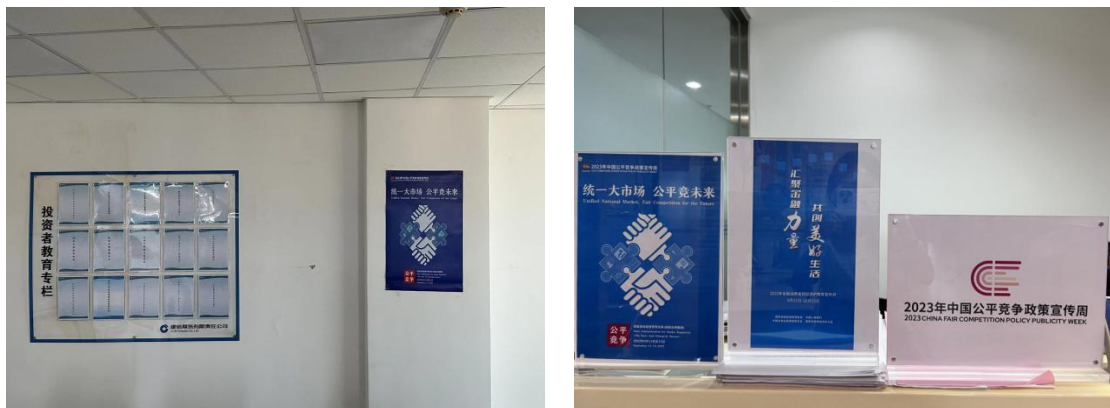
图 3：分支机构在营业场所张贴及摆放主题海报