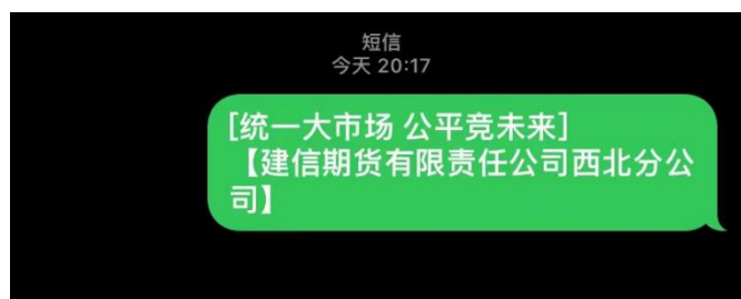
图 10：分支机构短信宣传