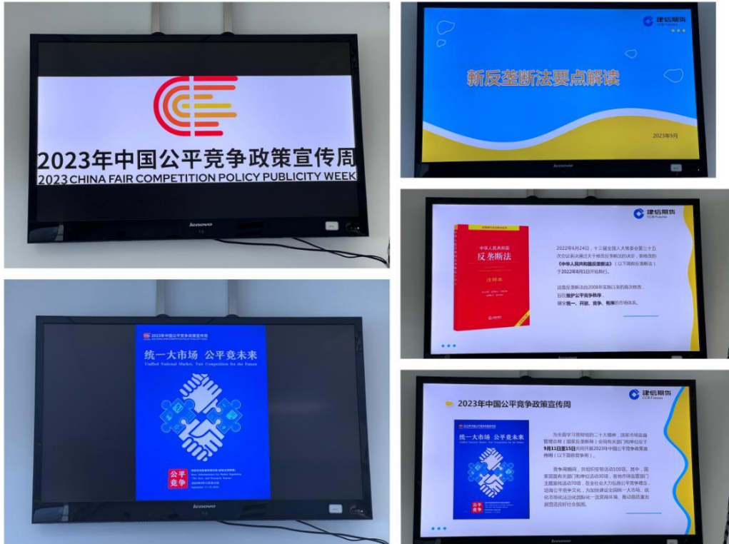
图 4：分支机构电子屏循环滚动播放宣传海报及 PPT